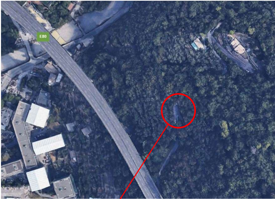
Via Alpini d'Italia, innesto strada località Baita